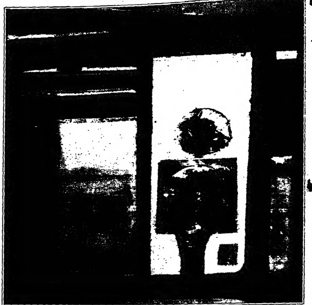
من أعمال الفنان علي الفول